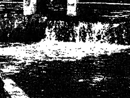
قاع الريم يتدفق